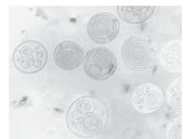
Electronenmicroscopische opname van een DR. BAUMANN product met meervoudige liposomen.