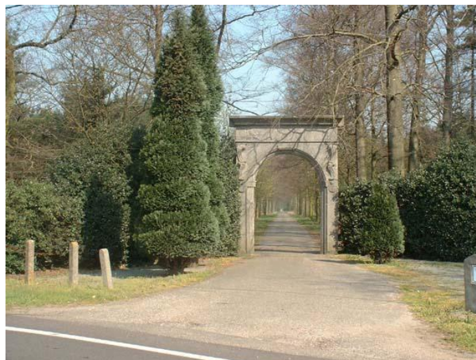
Poort naar Sterbos 1: hier niet inrijden!

Opgelet: de inrijpoort die u hier onder ziet, is de officiële inrit van het Sterbos, maar leidt naar het kasteel, en dus niet naar Dr. Baumann International. Hier mag u niet inrijden. U bent wel vlakbij. U moet – in de richting van Nederland - de inrit op 500 meter hiervandaan nemen, tussen de twee grote grijze betonnen zuilen. De toegang is op het laatste kaartje hieronder aangegeven met een zwart blokje (pagina 4 van deze wegbeschrijving).